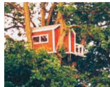
Hotell Hackspett (1998) är ett hus på elva kvadratmeter, tretton meter upp i en ek i Vasaparken i Västerås. Huset har säng, campingkök, torrass och två terrasser.