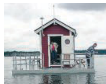
På flytbryggan ovanför hotellrummet finns ett rött hus med kök och toalett.